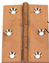
Hængsler ved røde pile