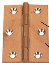
Hængsler ved røde pile